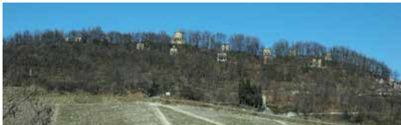
Sacro Monte di Crea: interno della Cappella XXIII (Il Paradiso); panoramica con le Cappelle e esterno della Cappella del Paradiso

A seguito di devastazioni avvenute all'inizio dell'Ottocento il complesso venne ampiamente rimaneggiato.