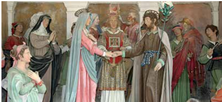
Sacro Monte di Oropa: salita alle Cappelle; Cappella dello Sposalizio di Maria; Cappella della Concezione di Maria (particolare della volta)

Venne edificato a partire dal 1617 in aggiunta al Santuario mariano preesistente, fra i più antichi edifici di culto del Piemonte e di più grande influenza devozionale. La sua costruzione coincise con i grandi interventi di trasformazione promossi dai Savoia, che coinvolsero l'insieme delle fabbriche costituenti il vasto complesso monumentale dedicato alla Madonna Nera.