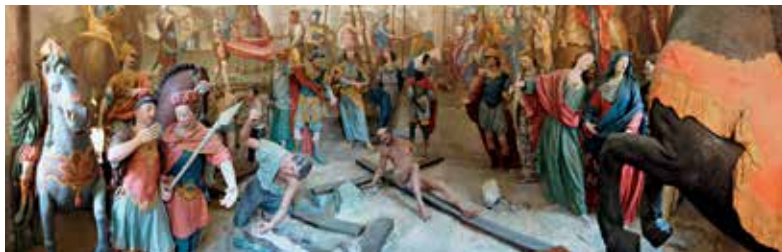
Sacro Monte Calvario di Domodossola, XI Stazione

L'Unesco ha riconosciuto le peculiarità del fenomeno dei Sacri Monti e inteso rilanciare il loro ruolo per la tutela, la conservazione e la valorizzazione del complesso e integrato sistema di beni e di valori che li compongono in un disegno unico ed unitario (natura, paesaggio, storia, arte, architettura, urbanistica, tradizioni, devozione, ecc.) e tuttora soprattutto dedicati alla fruizione devozionale e ad un turismo attento agli aspetti storico, artistici e paesaggistici.