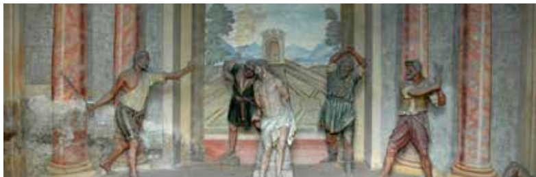
Sacro Monte di Ossuccio, Cappella VII, (La Flagellazione)

La loro valorizzazione passa non solo attraverso la conservazione dei particolari patrimoni, storici, artistici, architettonici e paesaggistici, ma anche attraverso il recupero e la rivalizzazione delle tradizioni culturali, artistiche, artigianali e sociali proprie delle comunità che ne hanno curato la realizzazione in cinque secoli di storia e degli eventi e cerimonie che scandiscono il ritmo delle stagioni e della loro vita.