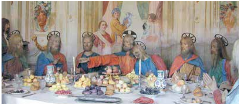
Sacro Monte di Varallo: Piazza dei Tribunali; Cappella XX (L'Ultima Cena); Cappella I (Adamo ed Eva)

È il più antico dei Sacri Monti, essendo stato eretto a partire dal 1491 da Bernardino Caimi, frate Minore Osservante, già custode in Terra Santa. Caratterizzato da una complessa e articolata progettualità urbanistica imitativa dei Luoghi Santi di Palestina, il Sacro Monte subì nel tempo molteplici trasformazioni, costituendo sempre un modello di riferimento artistico e iconografico per gli altri Sacri Monti.