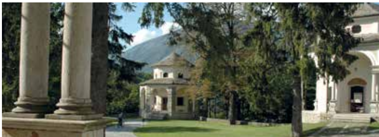
Sacro Monte Calvario di Domodossola: IX Stazione; percorso devozionale con le Stazioni IX e XI e interno della XIII Stazione (Deposizione)

Il Santuario fu consacrato nel 1690 mentre il Monte Calvario subì numerosi rimaneggiamenti sino alla prima metà del Novecento.