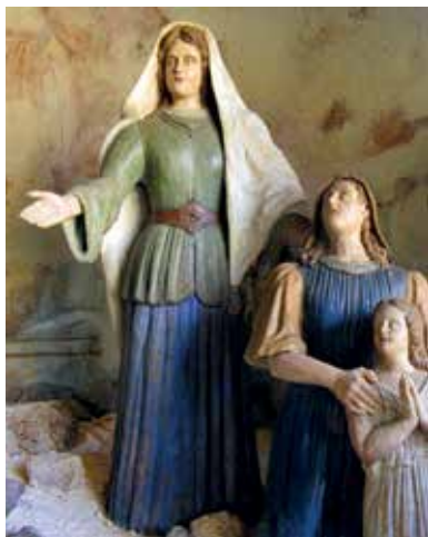
Sacro Monte di Belmonte, Cappella VIII (Le Pie Donne)

UNESCO PATRIMONIO MONDIALE SACRI MONTI del Piemonte e della Lombardia Iscritti nella lista del Patrimonio Mondiale nel 2003