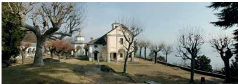
Sacro Monte della SS. Trinità di Ghiffa, Panoramica