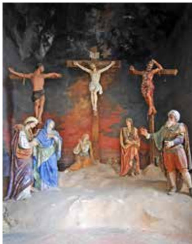
Sacro Monte di Crea, (Crocifissione)