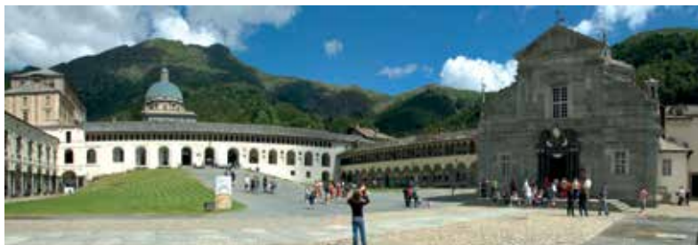
Sacro Monte di Oropa, Panoramica con i due Santuari