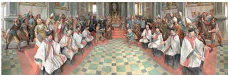
Sacro Monte di Orta, Cappella Cappella XX, (Canonizzazione di San Francesco)

Natura, architettura, belle arti si integrano infatti armoniosamente nel “gran teatro montano” dei SM (così come li ha definiti Giovanni Testori in un saggio su Gaudentio Ferrari); paesaggi di particolare bellezza ed unici in cui da un lato “tutti” si sentono coinvolti in quanto capaci di fare emergere e suscitare il comune desiderio di pace, di bellezza, di armonia, e dall’altro intere comunità vi si riflettono e si riconoscono perchè rappresentano una parte rilevante della loro storia e della loro cultura, ricordano momenti della loro vita sociale ed individuale, documentano nella forma più alta i loro saperi e tradizioni, la loro capacità di innovare e di crescere.