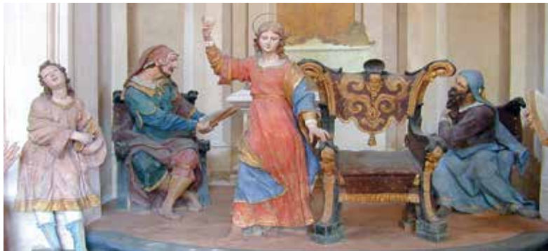
Sacro Monte di Ossuccio: La Via delle Cappelle; Cappella V (La Disputa di Gesù con i Dottori nel Tempio); Cappella I (L'Annunciazione)

Posto sul lato occidentale del Lago di Como il Sacro Monte ha un notevole valore paesistico. Le Cappelle rappresentanti i Misteri del Rosario, furono realizzate fra il 1635 ed il 1710 lungo il percorso ascensionale che conduce al Santuario della Beata Vergine del Soccorso. Come per gli altri Sacri Monti l'insieme della vegetazione e delle Cappelle costituisce un aspetto inscindibile del paesaggio.