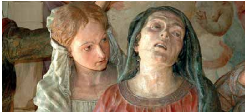
Sacro Monte di Varese: Cappella V (Disputa al Tempio); Cappella X (La Crocifissione); Cappella III (La Natività)

Posizionato su un luogo di culto medioevale, poi sede di un convento di monache e di un Santuario dedicato alla Vergine Maria, il Sacro Monte venne edificato a partire dal 1604 dal frate cappuccino Giovanni Aguggiari. Il percorso devozionale si sviluppa dalle vicinanze di Varese alla cima del Monte Velate e rappresenta i Misteri del Rosario che, dopo la battaglia di Lepanto nel 1571, erano divenuti fonte di ispirazione della devozionalità religiosa in Europa.