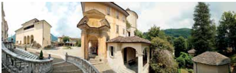
Sacro Monte di Varallo, Panoramica

Il riconoscimento per i “Sacri Monti del Piemonte e della Lombardia” è la conclusione di un lavoro avviato nel 1999 da parte dei Settori Pianificazione Aree protette, Musei e Patrimonio culturale della Regione Piemonte, dalla Soprintendenza Regionale per il Piemonte e dal Gruppo di lavoro permanente per la Lista del Patrimonio Mondiale dell’Unesco costituito presso il Ministero dei Beni e delle Attività culturali.