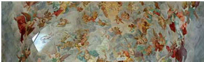
Sacro Monte di Varese, volta della Cappella X, (La Crocifissione)