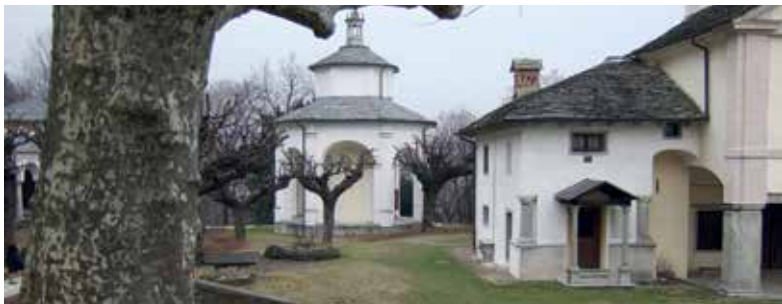
Sacro Monte di Ghiffa: Cappella di San Giovanni Battista; Santuario e Cappella di San Giovanni; interno della Cappella di Abramo

Nel 1647 venne edificata la Cappella dell'Incoronata mentre si deve far risalire al Settecento l'origine della Via Crucis disposta sotto un lungo porticato adiacente al Santuario.