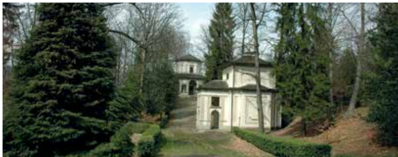
Sacro Monte di Orta: Cappella XII (Cristo approva la regola francescana); Cappelle VII e IX; Cappella I (Nascita di San Francesco)

Sovrastante l'abitato di Orta, il Sacro Monte venne edificato alla fine del Cinquecento su progetto del frate cappuccino Cleto da Castelletto Ticino. L'insieme delle cappelle si affaccia sul Lago d'Orta con aspetti paesistici altamente scenografici e suggestivi. Il complesso è dedicato a san Francesco, riproposto in chiave di imitatore di Cristo. Per questa sua specificità - l'essere dedicato ad un santo anziché alla vita di Cristo o di Maria - si differenzia nettamente dagli altri Sacri Monti.