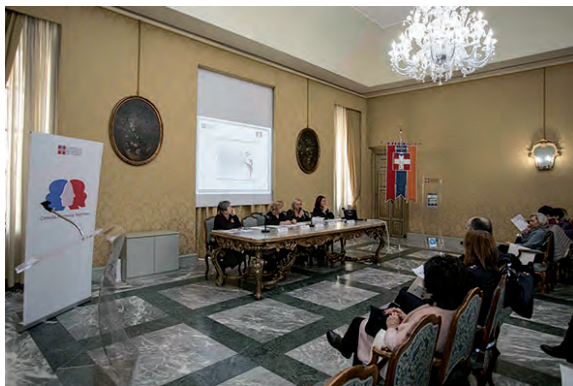
La presentazione a Palazzo Lascaris del progetto "Il Piemonte contro la violenza di genere".

Il 56% dei rispondenti ha inoltre la possibilità di garantire a donne a rischio l'accesso a una struttura abitativa protetta. Otto Centri anti violenza su 10 hanno la possibilità di utilizzare, all'occorrenza, una casa protetta, mentre nell'ambito del privato sociale solo 4 associazioni su 10 riferiscono di essere in grado di offrire l'accoglienza in un luogo sicuro.