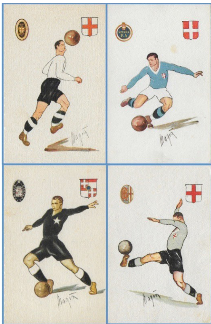
Le quattro squadre sulle celebri cartoline delle "Edizioni Magià"