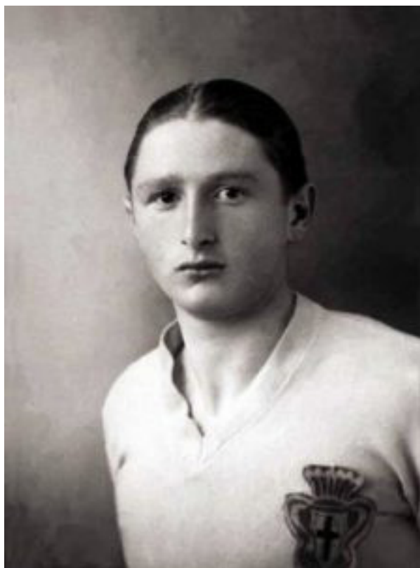
Sedicenne nella Pro Vercelli

L'attaccante sente il bisogno di tornare al nord e di avvicinarsi a casa. Per via del blocco dei campionati dovuto alla guerra, il ragazzo ottiene il permesso temporaneo di giocare per il Torino, che disputa il campionato d'Alta Italia. In coppia col grande Valentino Mazzola, Piola mette a segno 27 reti in una