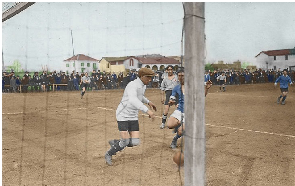
Novara-Alessandria nel campionato 1914-'15

che la fantasia immaginava come cinte da mura merlate e le colubrine puntate dall'alto delle torri. Fra Vercelli e Casale, Novara e Vercelli i tifosi sciamavano su biciclette e carrozzelle. Il pittoresco dialetto provinciale condivideva le loro invettive già alle porte della città rivale, gli avversari li attendevano. Che pugni, Madonna mia!'