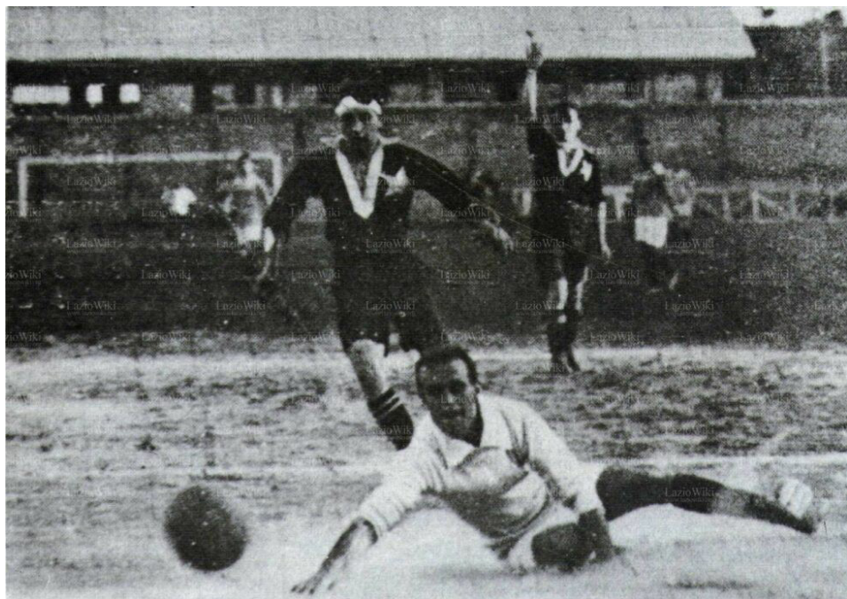
5 luglio 1914, un'immagine di Casale-Lazio, la finalissima dello Scudetto

ferroviaria. Inoltre, al lungimirante presidente dei nerostellati, è stata riservata una pietra d'inciampo, uno dei sampietrini che l'artista tedesco Gunter Demnig ha ideato per preservare la memoria delle vittime della Shoah, collocandoli di fronte all'ultimo luogo dove viveva il deportato. Jaffe era residente in corso Indipendenza, ma si è optato per lo stadio Natal Palli , che dal 1921 ospita le partite del Casale, sostituendo il Priocco, quel campo romantico che era stato teatro delle imprese del glorioso Casale.