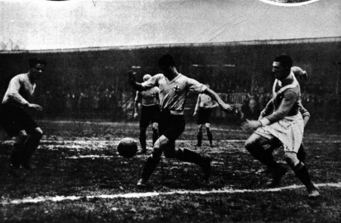
Foto PICCARRELLI. Un calcio d'angolo contro « Taranto ». Lente CAPPELLI

La fotocronaca di quell'Alessandria-Brescia su "Il Calcio"