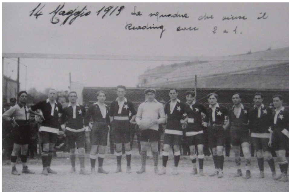
Il Casale che umiliò i Maestri inglesi