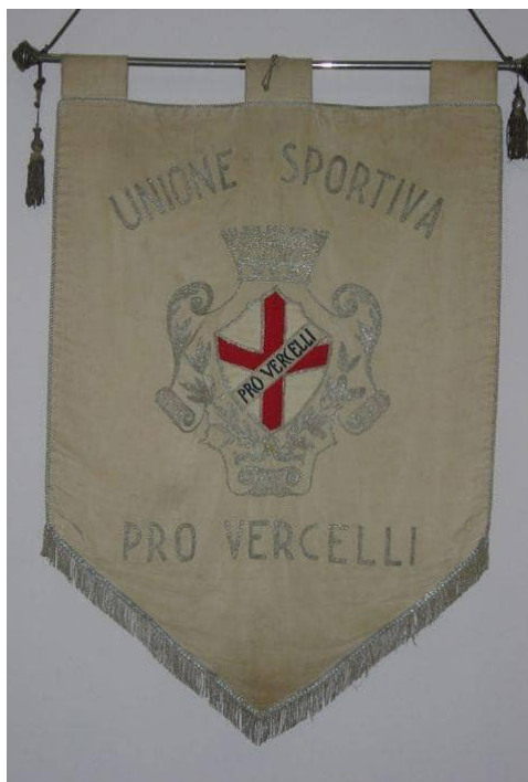
I gagliardetti delle squadre del Quadrilatero