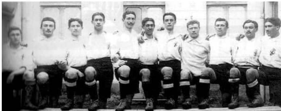
Le "Bianche Casacche" di Vercelli