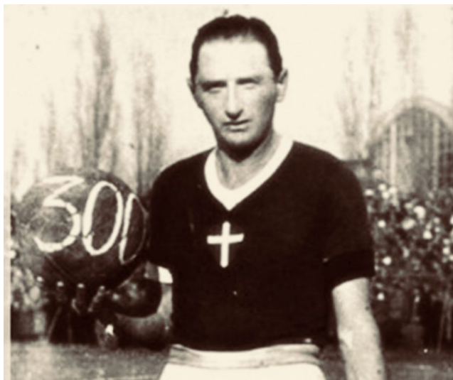
Silvio Piola nel Novara

Nel 1934 Piola cambia casacca. Nonostante i forti interessi di Inter e Torino, alla fine la spuntò la Lazio, società molto vicina al regime fascista. Il ragazzo debutta ufficialmente il 30 settembre dello stesso anno nella vittoria casalinga sul Livorno, segnando anche un gol. Le prime due stagioni del vercellese in maglia biancoceleste non sono però esaltanti, complice anche il suo nuovo ruolo da mezzala. L'annata 1936-'37 è invece spettacolare. La Lazio costruisce una squadra vincente – che chiuderà il campionato seconda dietro al Bologna – e Piola, tornato centravanti, vince il suo primo titolo di capocannoniere con 21 gol in 28 partite.