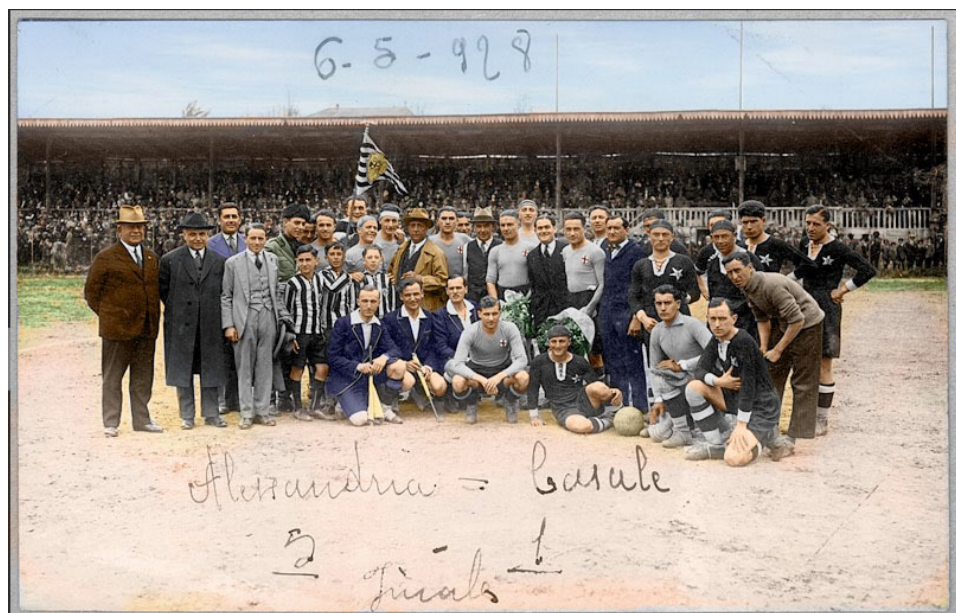
Alessandria-Casale 5-1, 6 maggio 1928

miglior livello italiano, ma non stupisce che il calcio tecnicamente più valido si giochi ad Alessandria, dove l'ibridazione etnica è più recente, e anche a occhio nudo è possibile rilevare una maggior aitanza della gente comune. Per essere composito, l'etnos del quadrilatero giustifica avversioni municipali che la dicono lunga sul carattere di questi padani. Il calcio offre magnifici pretesti a faide collettive e ricorrenti. Scendere sul campo di questa o di quella città significa essere pronti a qualsiasi conseguenza, non escluso il ricovero in ospedale”.