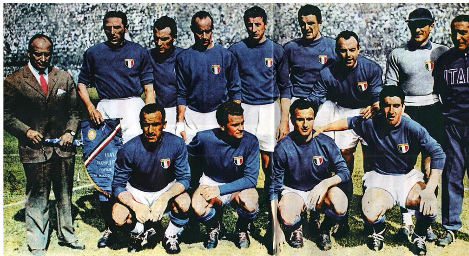
Piola (in piedi, secondo da sinistra) alla sua ultima partita in nazionale, il 18 maggio 1952 contro l'Inghilterra; l'attaccante venne riconvocato in azzurro dopo un lustro – all'età di 38 anni – come omaggio a un atleta che nel campionato appena concluso era stato ancora capace di mettersi in spolvero (18 reti con la maglia del Novara)

squadra costruita attorno a lui, e si trova subito a meraviglia. Il centravanti - ormai un po' datato - è protagonista dell'immediata promozione in Serie A nel 1947-'48. Rimanendo stabilmente a giocare tra i più forti, Piola infila sette stagioni con gli azzurri, regalando loro 86 gol in 185 match. Nonostante l'età, Piola continua a segnare a ripetizione e in ogni modo, senza mai abbandonare il suo gesto tecnico più famoso: la rovesciata. Il ragazzo originario della provincia di Pavia segna il suo ultimo gol tra i professionisti il 7 febbraio 1954 nel pareggio casalingo contro il Milan. Alla fine di quell'anno, saranno solo 5 le marcature per lui in 9 partite. La sua ultima partita ufficiale risale invece al 7 marzo 1954, in quel disastroso 0-4 contro l'Atalanta. Al termine della stagione, Silvio Piola decide quindi di appendere le scarpette al chiodo.