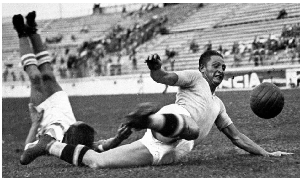
Acrobazia di Silvio Piola con i colori della Lazio