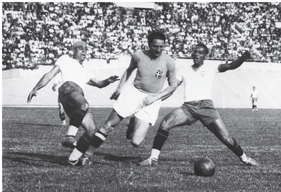
Contro il Brasile ai Mondiali del 1938 in Francia

dicembre 1946, nella vittoria casalinga contro l'Austria. L'ultima apparizione in campo si registra invece addirittura il 18 maggio 1952, a Firenze, nell'1-1 con l'Inghilterra: Piola aveva 38 anni e 7 mesi.