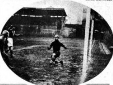
Il primo goal alessandrino.

cora da Ferrati per i grigi mentre Banchemo batteva per la terza volta i bresciani che al 20 coglievano il loro unico punto con Barbieri III. In seguito ad una debole risposta di Morandi, Ferrati segnava quindi il quarto ed ultimo goal per la sua squadra al 38. Arbitro Mangano.