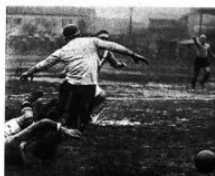
Banchemo in area bresciana.