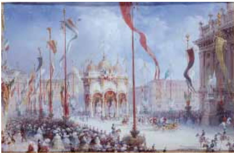
Inaugurazione del Parlamento a Palazzo Madama