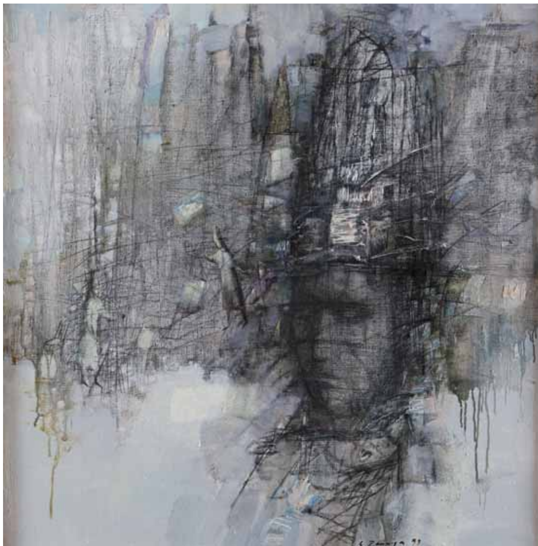
Simion Zamša - SPIRITUALITÀ MOLDAVIA 1994 - h 80 cm x l 80 cm olio su tela