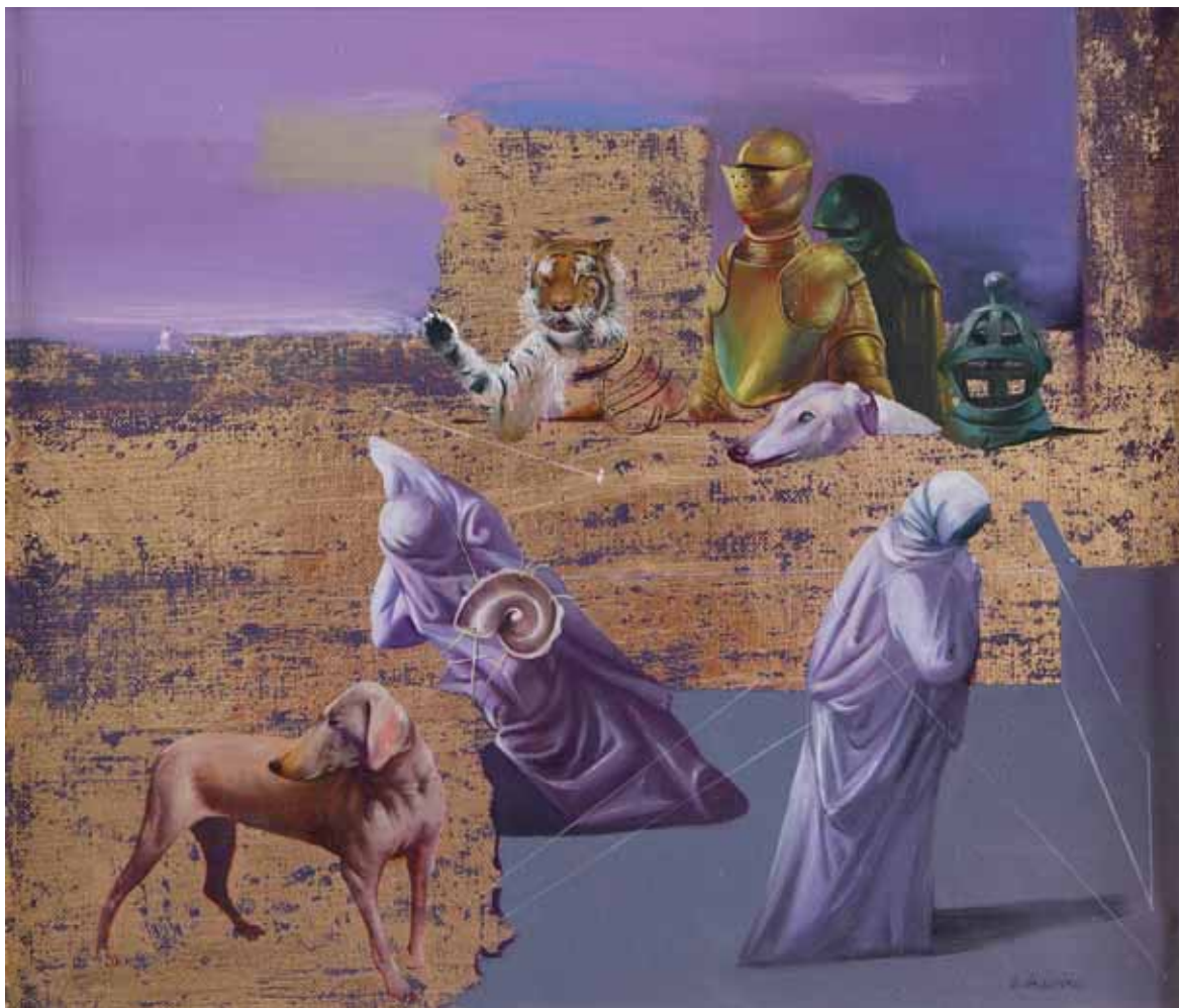
Viktor Alsevsij - MEMORIE ANTICHE E MODERNE anni 1990 BIELORUSSIA - h 50 cm x l 60 cm olio su tela