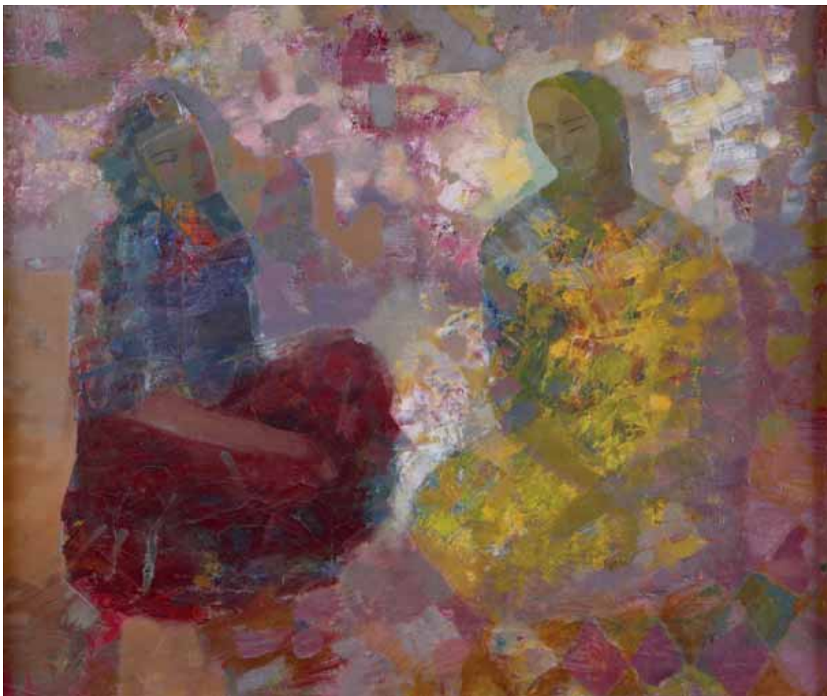
Adis Keneebekovitch Seitaliev - DIALOGO KYRGHZISTAN 1999 - h 75 cm x l 69 cm olio su tela