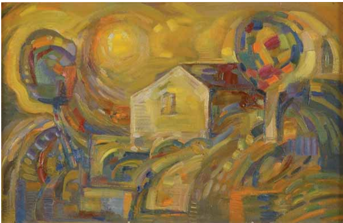
Grigori Danelian - CASA CON ALBERI 1998 ARMENIA - h 63 cm x l 39,5 cm olio su tela