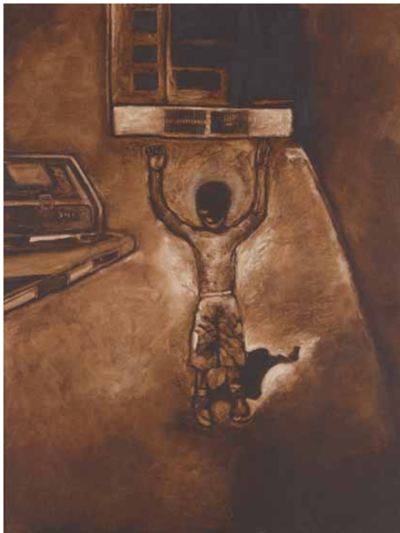
Mervat Hakroush Akko - IL MIO QUARTIERE PALESTINA 2009 - h 87 cm x l 67 cm acrilico su tela