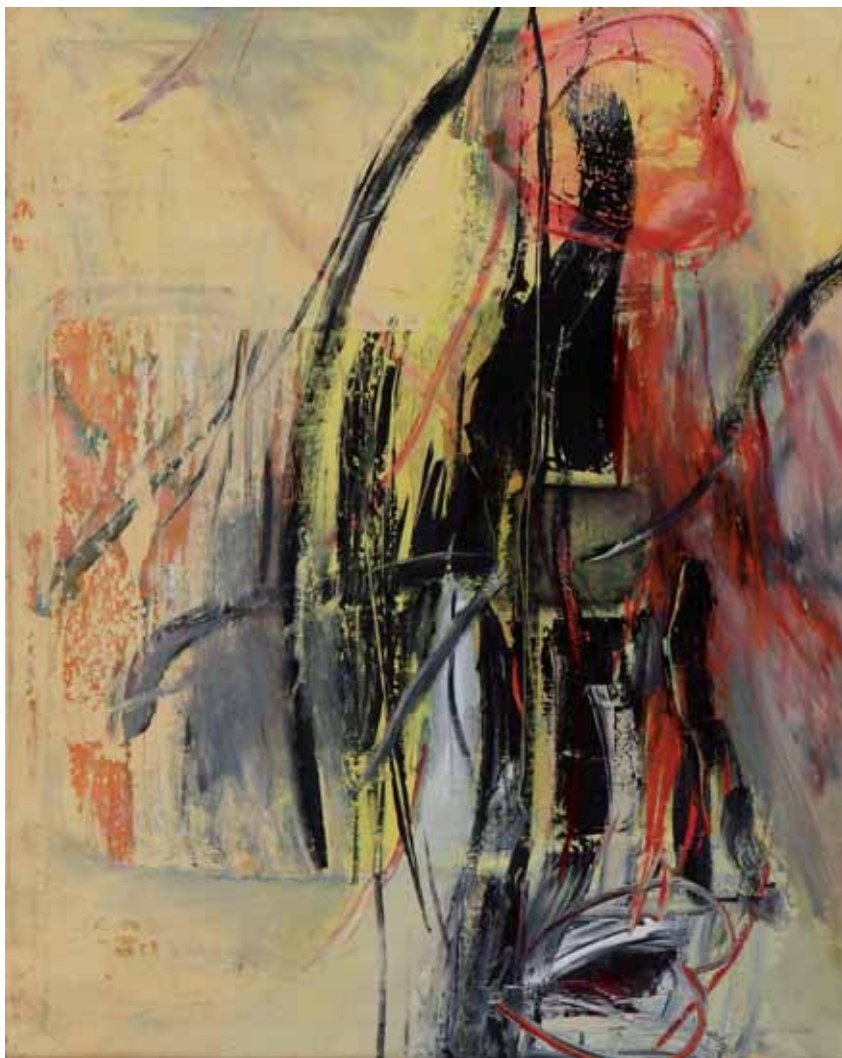
A-Kristring Kreg - DESIDERIO ESTONIA 1996 - h 73 cm x l 92 cm olio su tela