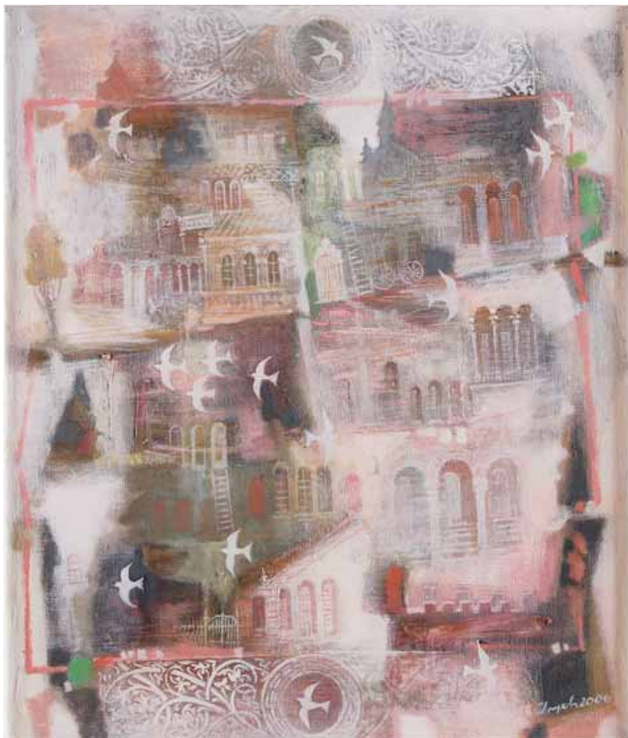
Svitlana Lopukhova - COLOMBE E PAESAGGIO FANTASTICO 2006 UCRAINA - h 70 cm x l 60 cm olio su tela