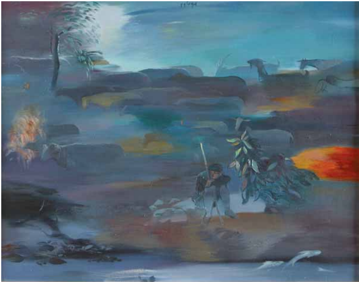
Zumakyn Kairambaev - PASTORALE 1999 KAZAKISTAN - h 50,5 cm x l 65 cm olio su tela