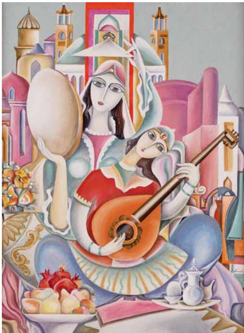
Kamil Asadov Gadziev - ORIENTE AZERBAIGIAN 2000 - h 100 cm x l 80 cm olio su tela