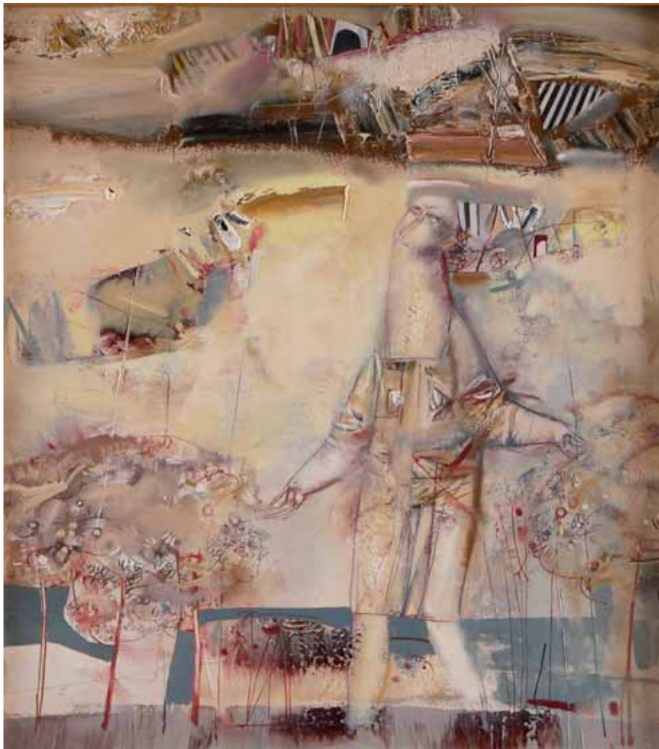
Mikola Zuravel - FIGURA UMANA ASTRATTA 2006 UCRAINA - h 60 cm x l 50 cm olio su tela