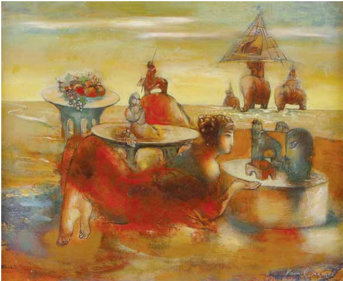
Kamil Kamal - BANCHETTO SUL MARE 2000 AZERBAIGIAN - h 40 cm x l 45 cm olio su tela