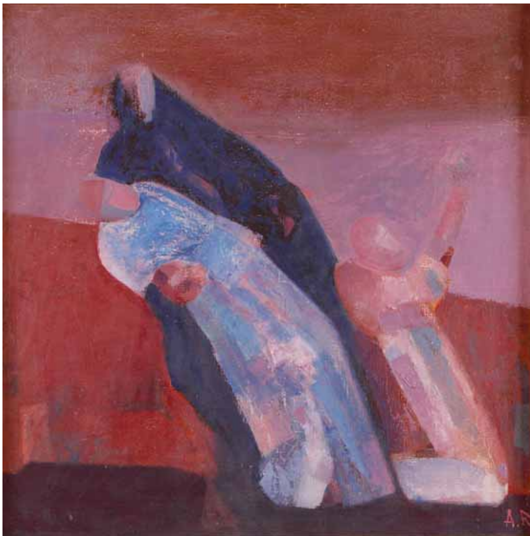
Anatol Rurac - FIGURE ASTRATTE MOLDAVIA 1991 - h 80 cm x l 80 cm olio su tela