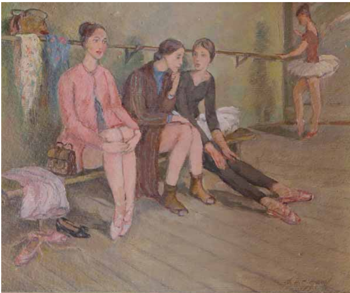
Aleksander Timofeevitc Chestacov - BALLERINE BIELORUSSIA 1996 - h 30 cm x l 35 cm olio su tela