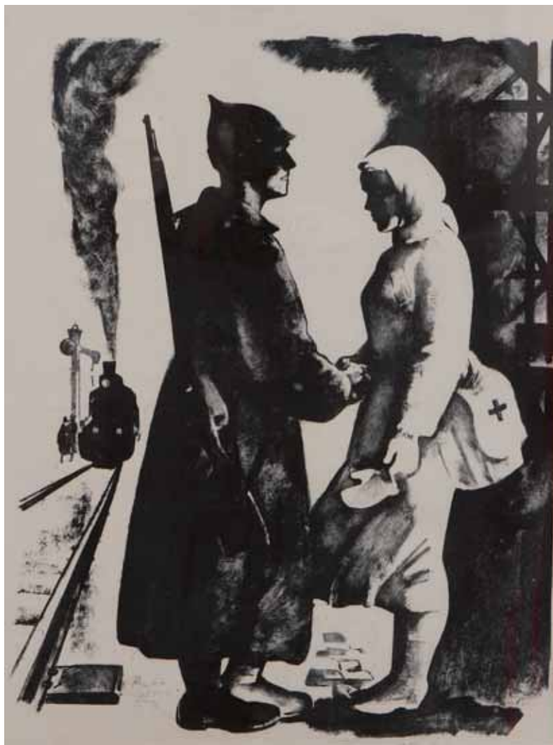
Nikolaj Valerianovich Scegllov - PARTENZA PER IL FRONTE 1987 RUSSIA - h 62,5 cm x l 46,5 cm incisione