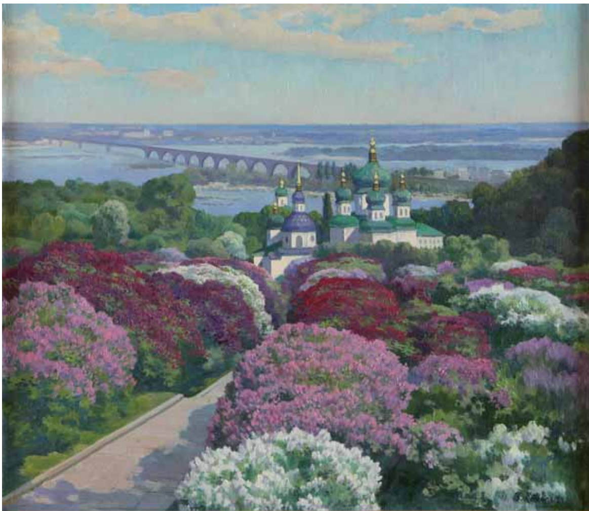
Vladimir Kochal - MONASTERO DI KIEV UCRAINA 1994 - h 60 cm x l 70 cm olio su tela