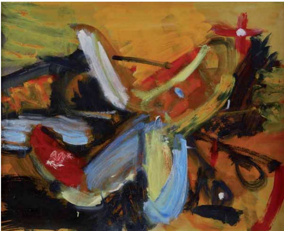
Ricardas Bartelevicius - GIOCATTOLE PER LIBRO D'ARTE 1999 LITUANIA - h 60 cm x l 82 cm olio su tela