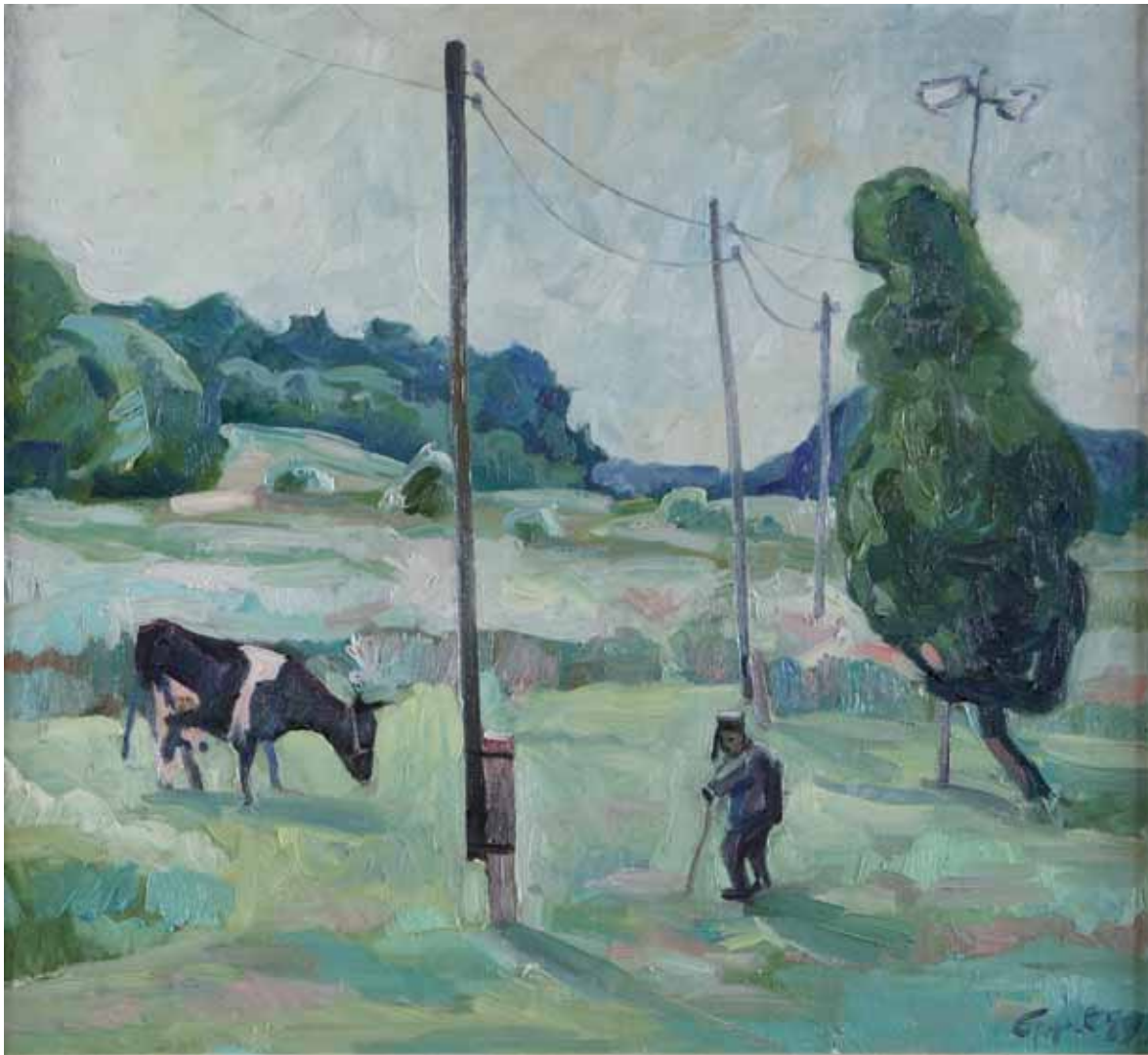
Leonid Sergeevic Epple - PASTORALE 1994 RUSSIA - h 59 cm x l 74 cm olio su tela