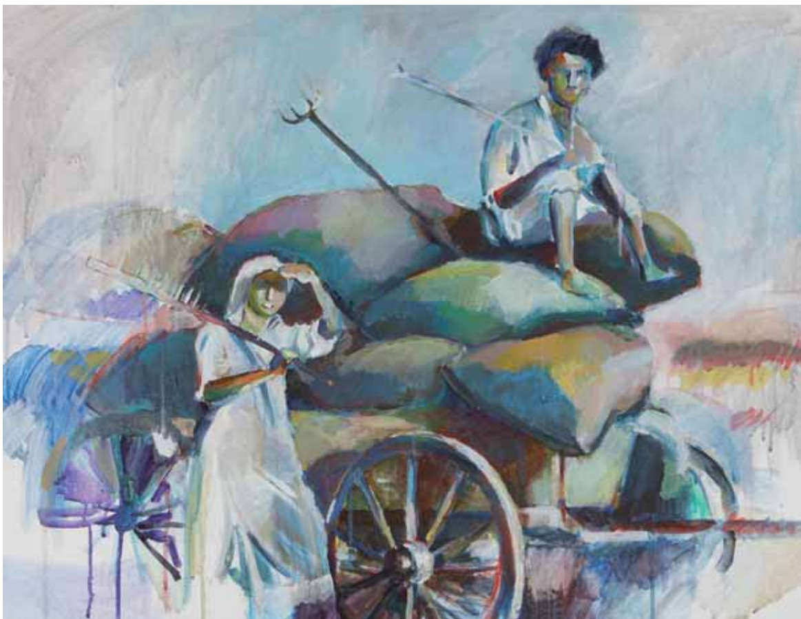
Elkana Blumental ISRAELE 2009 h 71 cm x l 91 cm acrilico su tela