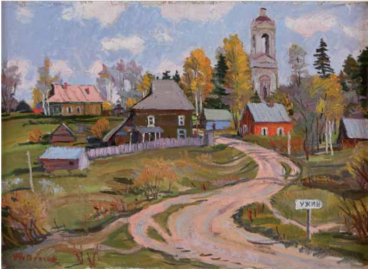
Oleg (Eugenij Nikanorovic) Goriacev - VILLAGGIO DI UZIN 1994 RUSSIA - h 50 cm x l 70 cm olio su tela