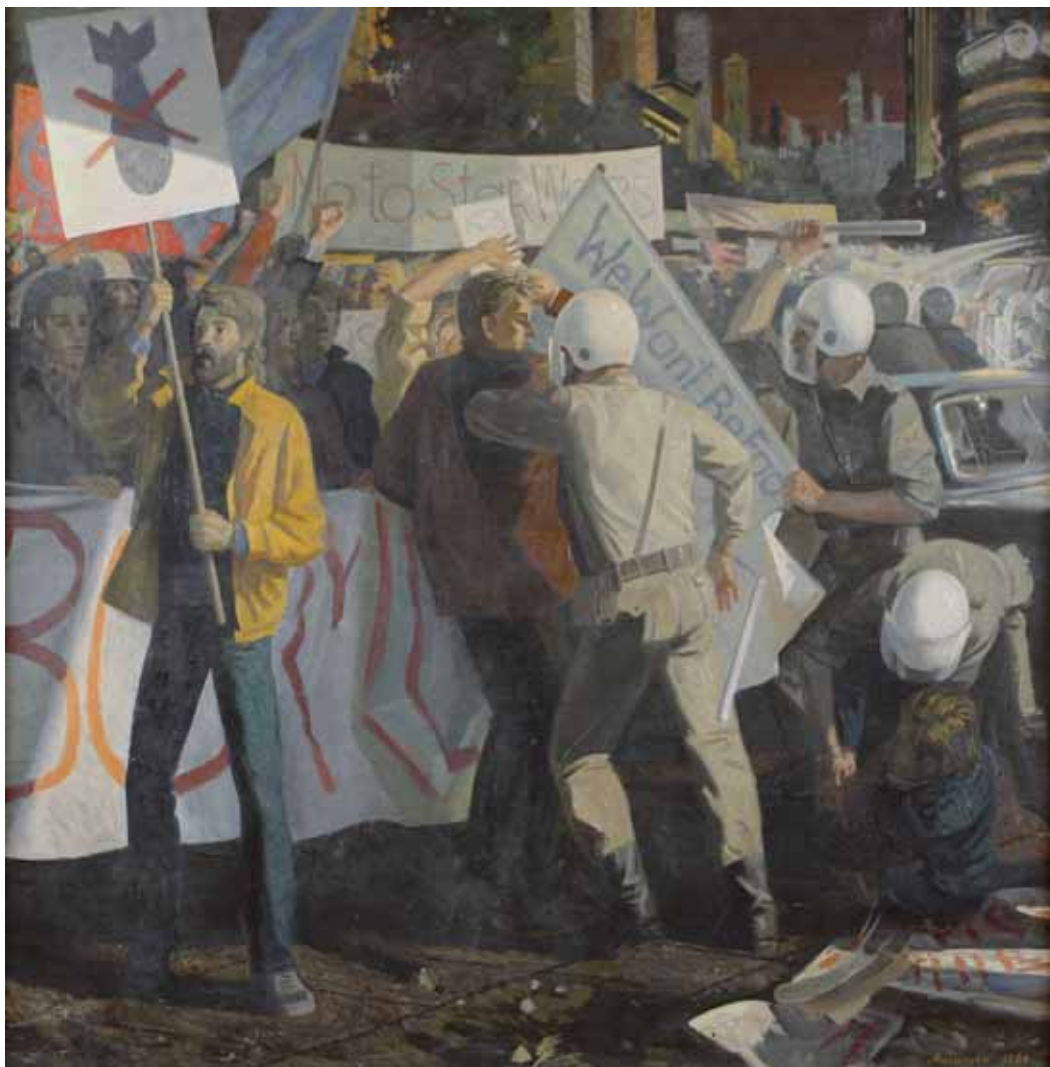
Aleksander Antokhin - MANIFESTAZIONE 1986 RUSSIA - h 166 cm x l 177 cm olio su tela