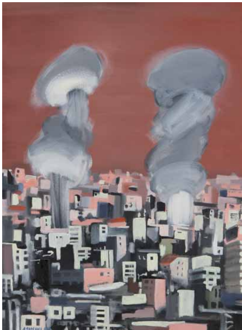
Reut Asimini - FUNGHI ISRAELE 2009 - h 87 cm x l 67 cm acrilico su tela