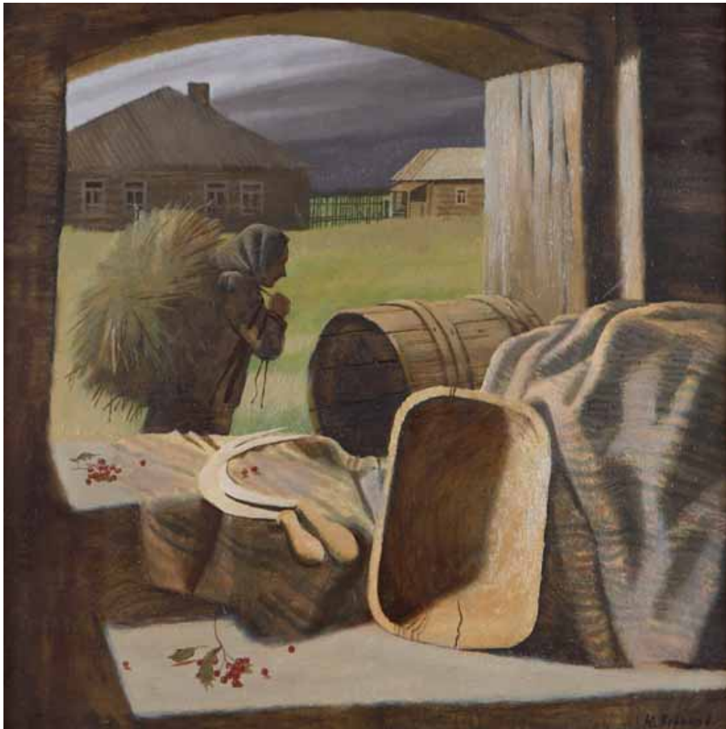
Jurij Aleksandrovi VORONOV - NONNA NATASCIA RUSSIA 1995 - h 90 cm x l 90 cm olio su tela