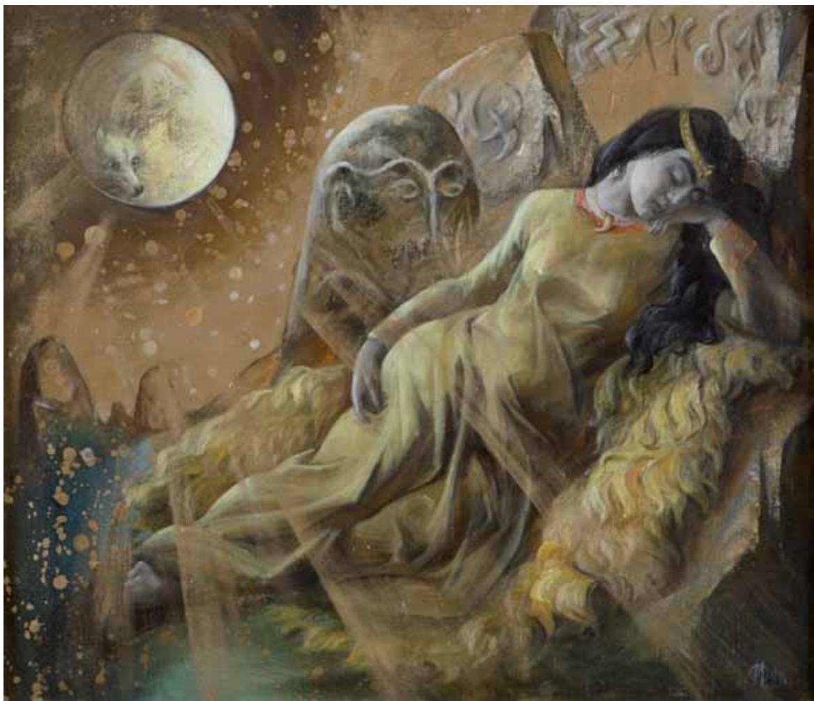
Orifdžion Minov - IL SOGNO Uzbekistan 1999 - h 60 cm x l 70 cm olio su tela