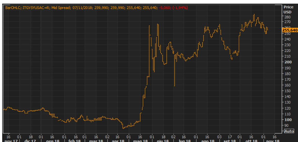
GRAFICO 2: ANDAMENTO CDS REP. ITALIA A 5 ANNI - STORICO

In riferimento invece al valore di mercato della componente denominata “ Credit Default Swap ”, va rilevato che l'andamento del prezzo del CDS Rep. Italia 5 anni nel corso della seconda metà del 2018 ha subito una forte crescita.