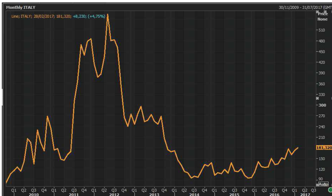
GRAFICO 2: ANDAMENTO CDS REP. ITALIA A 5 ANNI - STORICO

In riferimento invece al valore di mercato della componente denominata “ Credit Default Swap ”, va rilevato che l'andamento del prezzo del CDS Rep. Italia 5 anni nell'ultimo trimestre del 2017 è risultato in diminuzione.