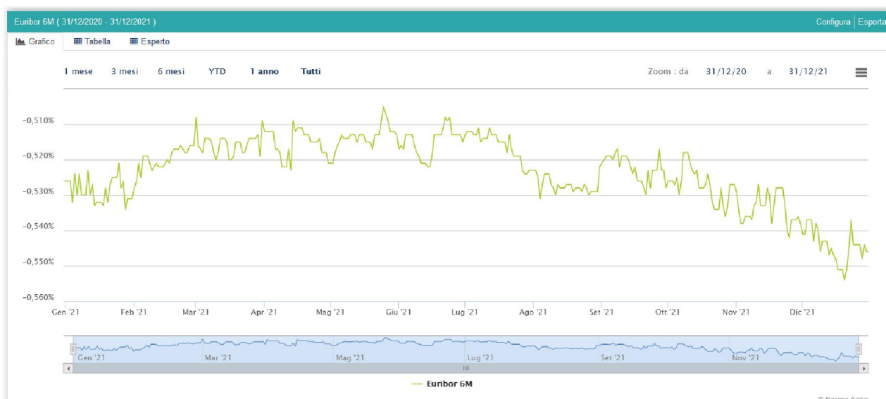
GRAFICO: ANDAMENTO DELL'INDICE EURIBOR 6 MESI: STORICO

In data 31 dicembre 2021, l'indice Euribor 6 mesi è stato fissato a -0,546% .