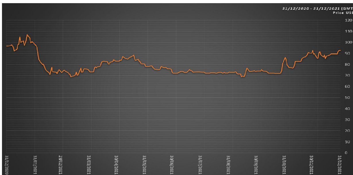
GRAFICO 2: CDS REP. ITALIA A 5 ANNI – STORICO 2021

In riferimento invece al valore di mercato della componente denominata “ Credit Default Swap ”, va rilevato che le quotazioni del CDS Rep. Italia 5 anni, registrate nel corso del 2021, sono rimaste per lo più stazionarie ad eccezione di quelle rilevate a fine 2021 che sono ritornate sui livelli di inizio anno