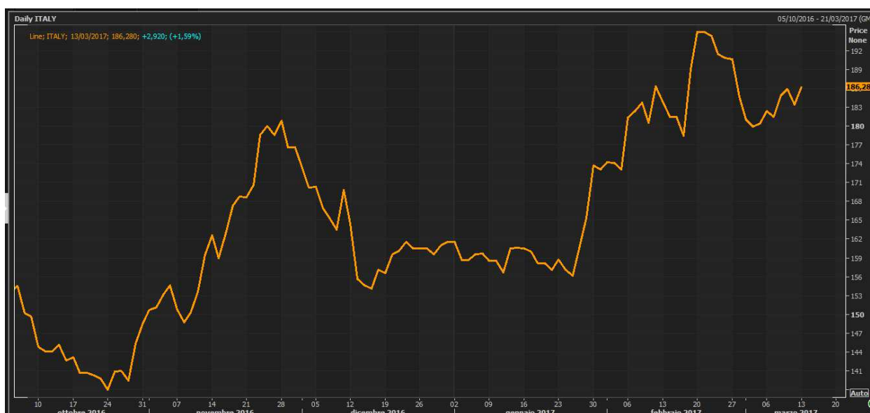
GRAFICO 2: ANDAMENTO CDS REP. ITALIA A 5 ANNI - STORICO

In riferimento invece al valore di mercato della componente denominata “ Credit Default Swap ”, va rilevato che l’andamento del prezzo del CDS Rep. Italia 5 anni nell’ultimo trimestre del 2016 è risultato in diminuzione.